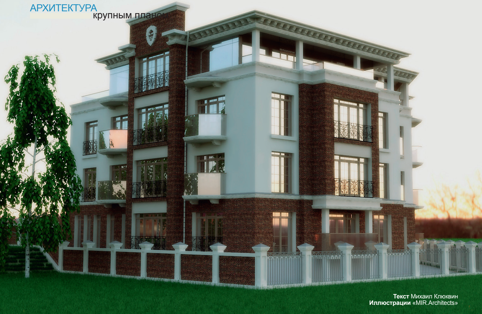
Текст Михаил Ключвин Иллюстрации «MIR.Architects»